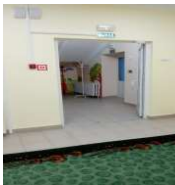
Фото № 14( коридор, зона ожидания)