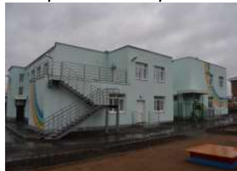
Восточная сторона здания