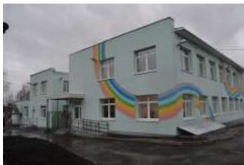
Северо-восточная сторона здания