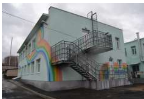
Северо-западная сторона здания