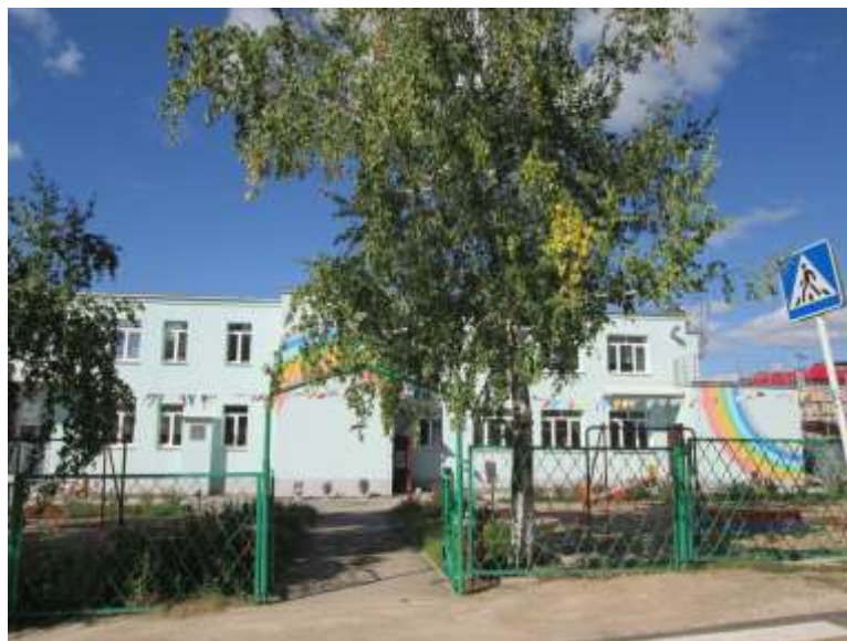
Фото №2 (территория, прилегающая к зданию)