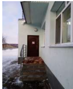
Фото №17 (пути эвакуации)