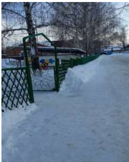
Фото № 11 (лестница наружная), (пандус наружный)