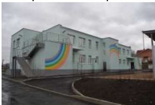
Юго-западная сторона здания